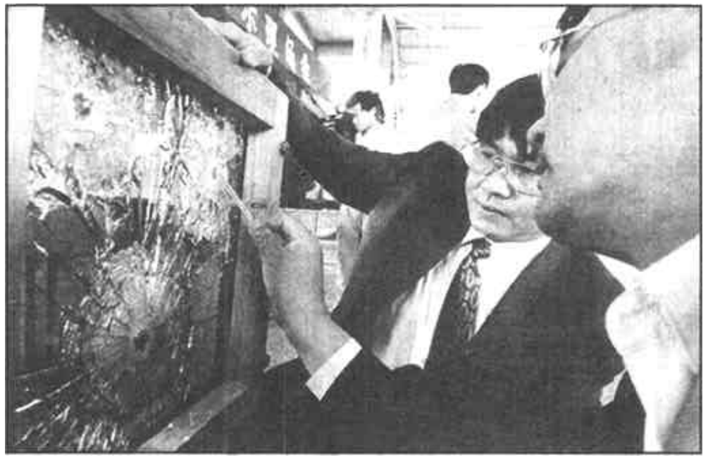
东营区为济南路“整容”,影响市容的广告牌已清理完毕。

本报讯 广告牌的铁杆一碰到气割机喷出的火花,所触部位立即化作火红的碎屑,散落到地上,一块块广告牌随之倒下。这是5月11日记者在济南路看到的对设置广告牌进行规范整治的一个小镜头。 济南路是西城的一条主要干道,也是西城繁华的街道之一。为营造现代化城市氛围,改善城市环境,塑造良好的城市形象,东营区按照“产权归谁、管理归谁、谁受益、谁出资,谁分管、谁负责”的原则对济南路进行重点整治。这次整治采取油地联手、部门配合、抓住重点、逐项突破、强化管理、分段达标、整体推进的方式,主要包括美化、绿化、净化、亮化等内容。 加强和规范广告设置管理是这次整治的一项重要内容,也是东营区打响的首项战役。东营区城建委、公安等部门密切配合,积极出动。大部分广告公司和业户顾全大局,在不到几天的时间里就拆除了大部分影响市容的各类广告牌,截止到5月11日,在城建委、公安等部门的积极协助下,济南路上影响市容的广告牌已清理完毕。 (扈美荣)